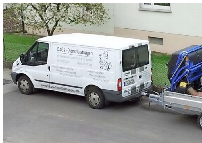
Die perfekte Gartenpflege und das Anlegen von Gärten ist auch ein Schwerpunkt von BAGS-Dienstleistungen - vom Frühjahr bis zum Herbst!

In dieser Jahreszeit bindet der Winterdienst viele Kräfte. Schon in aller Frühe sind die Männer von BAGS-Dienstleistungen mit ihren professionellen Räumgeräten unterwegs, um die weiße Pracht schnell zu räumen und die Gehwege zu streuen. Und dies an sieben Tage in der Woche, inklusive Versicherungs-